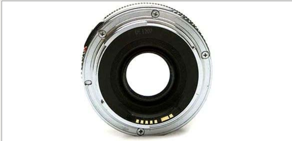
Obiettivo con 5 + 3 contatti dorati = non compatibile Extenders

L'Auto-Focus verrà automaticamente eseguito con una velocità leggermente ridotta per garantirne la massima precisione, in funzione della diminuita profondità di campo.