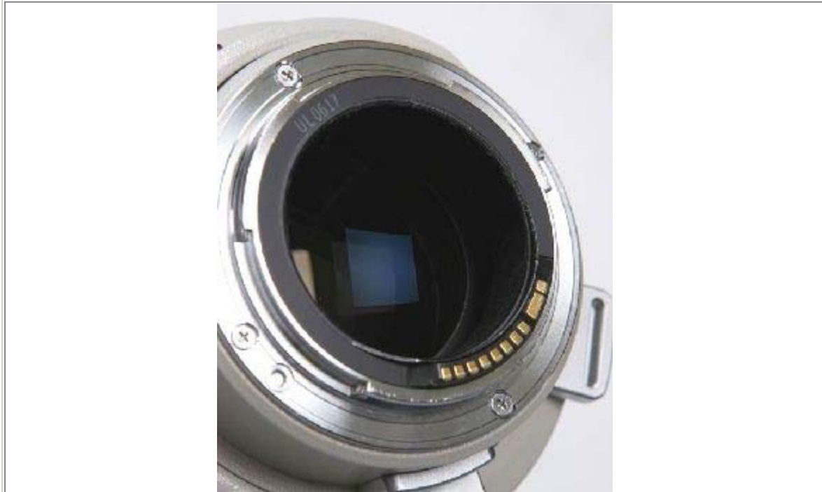
Obiettivo con 8 + 3 contatti dorati = compatibile Extenders