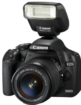
Luce Flash diretta frontale