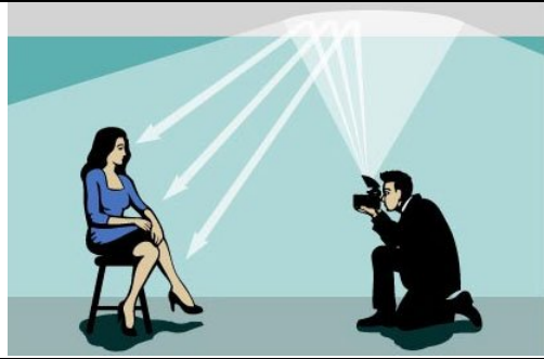
Luce Flash riflessa a soffitto