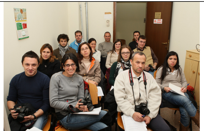
Luce Flash riflessa a soffitto

La prima fila fa ombra alla seconda fila, che fa ombra alla terza, che fa ombra alla quarta.