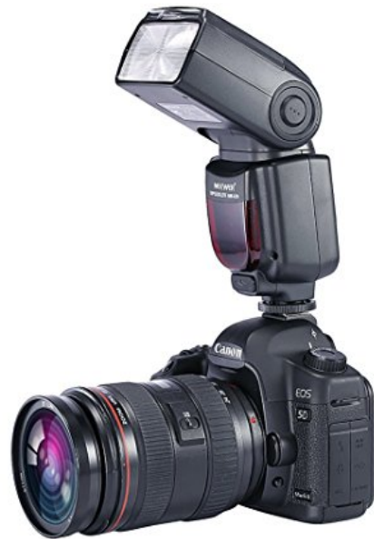
Luce Flash riflessa a soffitto