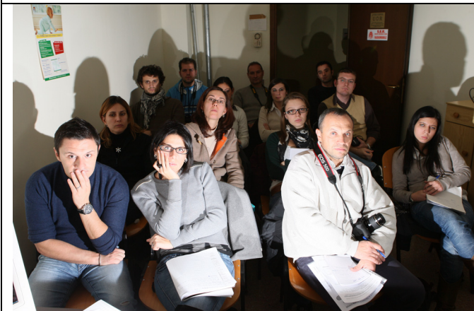
Luce Flash diretta frontale

La prima fila fa ombra alla seconda fila, che fa ombra alla terza, che fa ombra alla quarta.